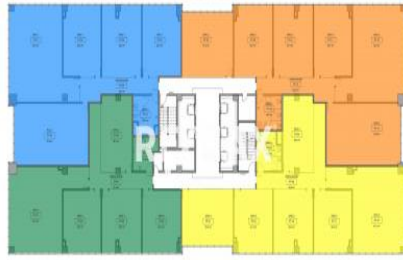
OTRAS CONFIGURACIONES DISPONIBLES 4 OFICINAS