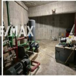
Sala de hidroneumática y tanque de agua