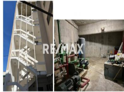
Escaleras de emergencia