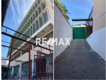
Fachada lateral con acceso directo a Planta Baja (jaulas con santa maria) y Sótano