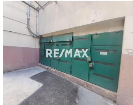
Sala de hidroneumática y tanque de agua