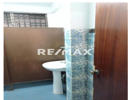
GALPÓN 471 m2 Barquisimeto Centro ALQUILER 800$